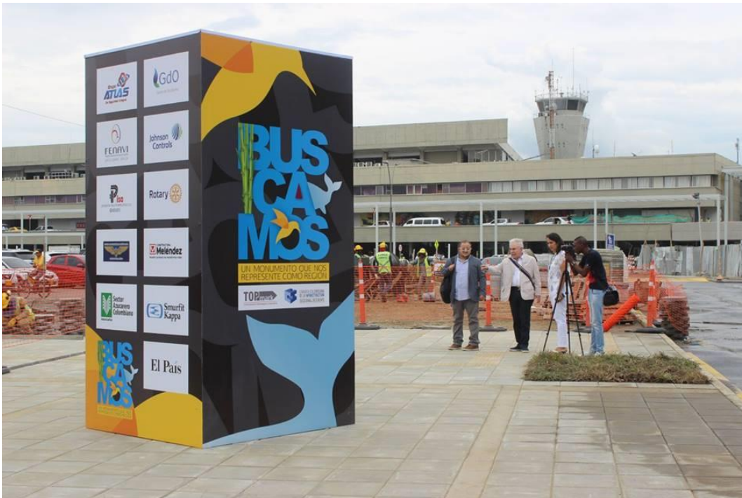
Totem que se instaló en el sitio donde estará ubicado el monumento.